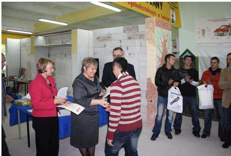
Wręczenie dyplomów i nagród.