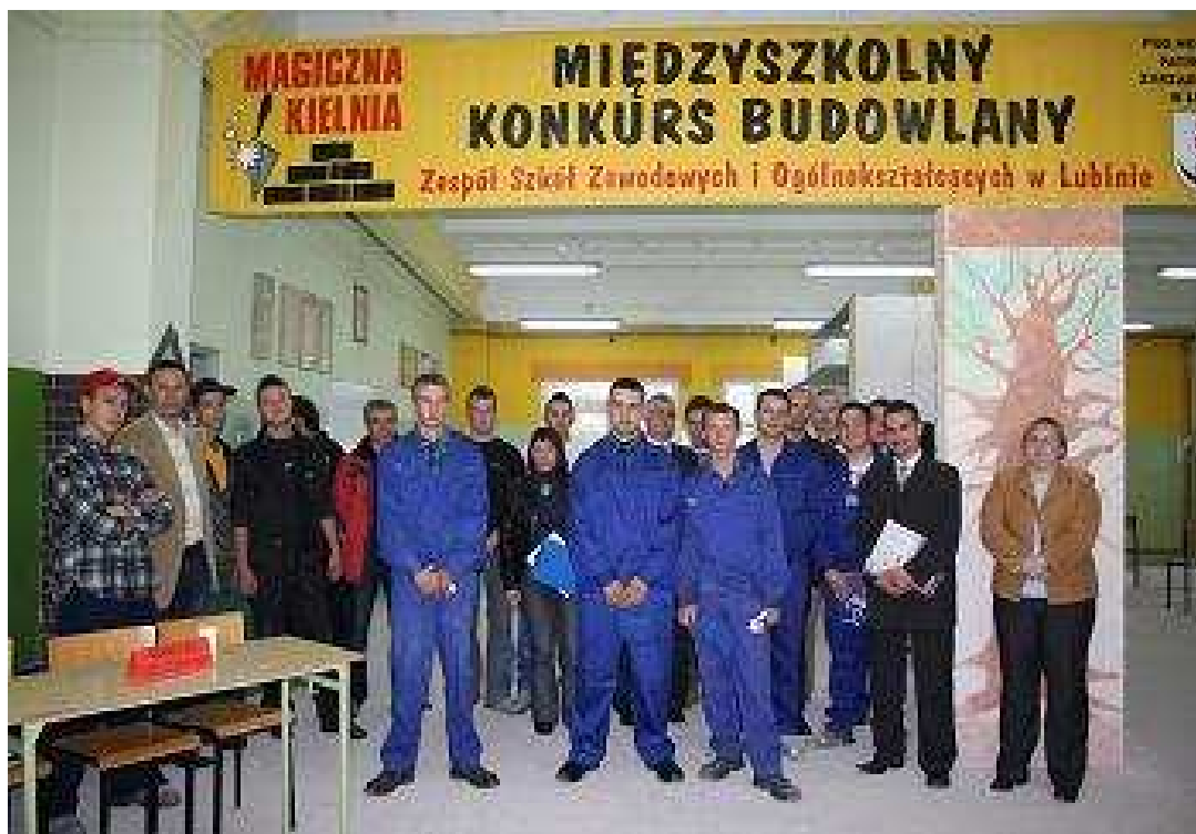
Uczestnicy Konkursu i opiekunowie.