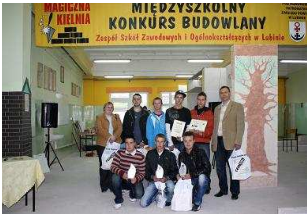
Pamiątkowe zdjęcie zwycięzców konkursu.