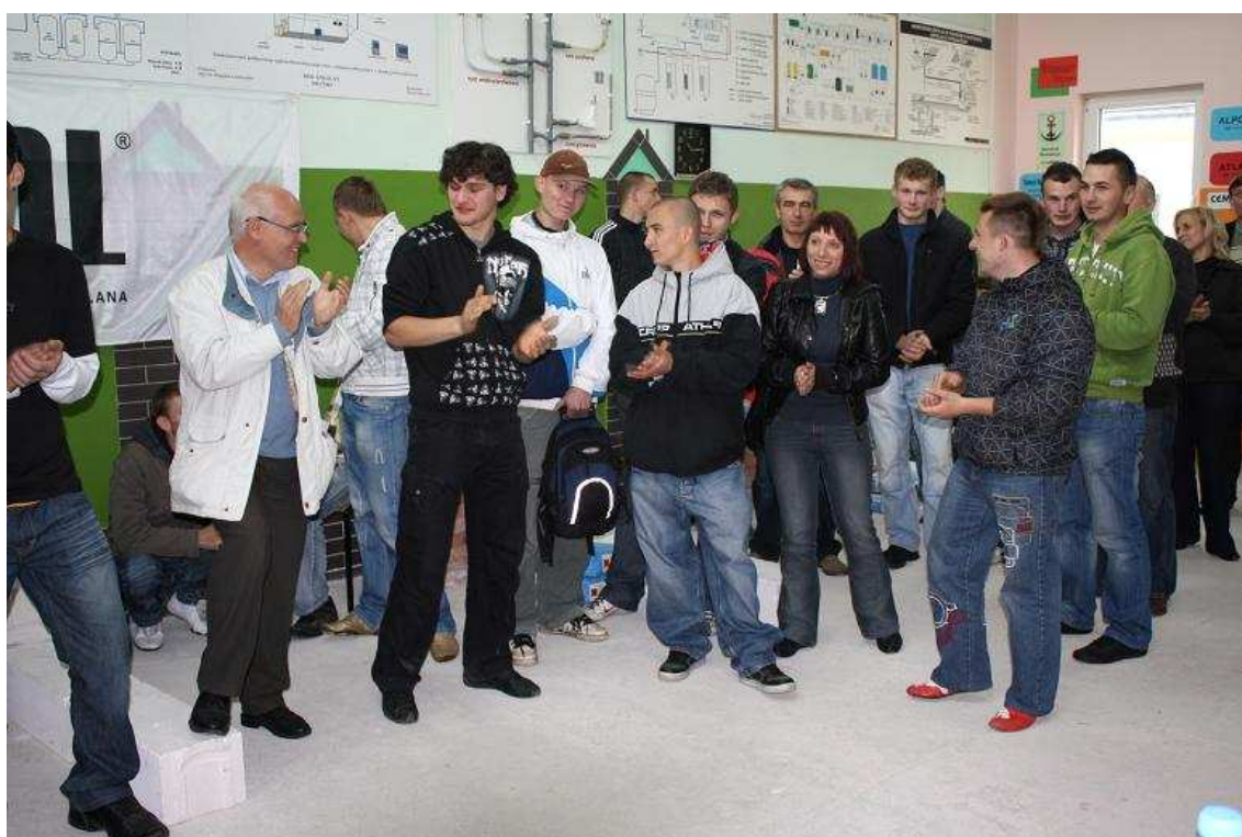
Uczestnicy Konkursu wraz z opiekunami.