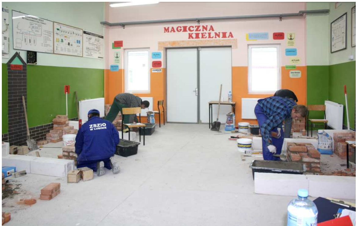
Murowanie to ciężka praca, ale warto powalczyć.