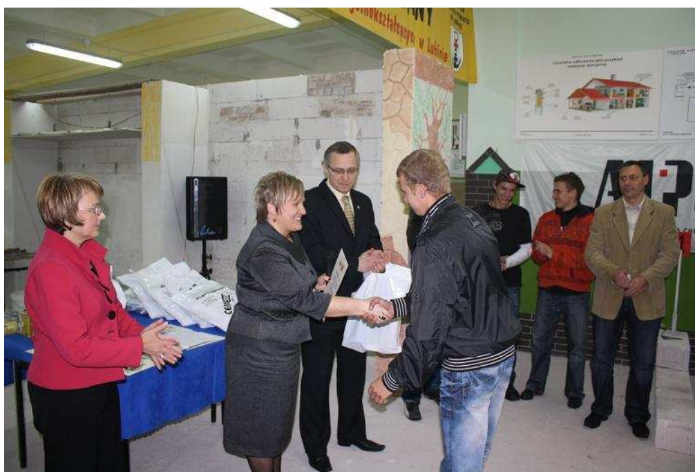
Wręczenie dyplomów i nagród.